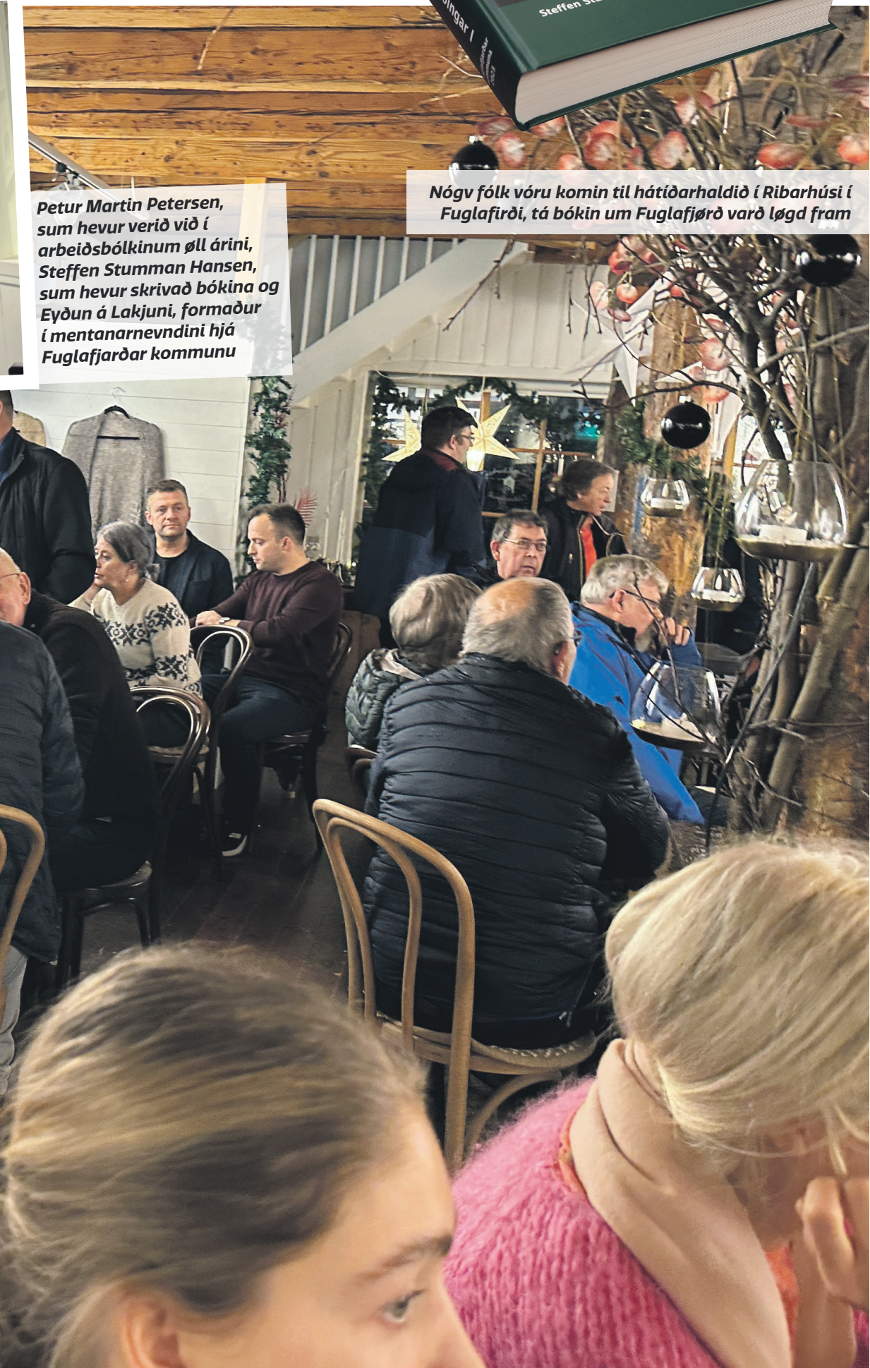
Nógv fólk vóru komin til hátíðarhaldið í Ribarhúsi í Fuglafirði, tá bókina um Fuglafjørð varð lögð fram